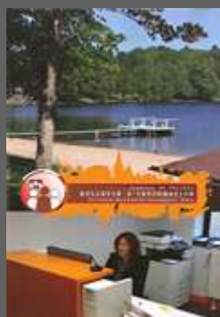
Bulletin Octobre 2014