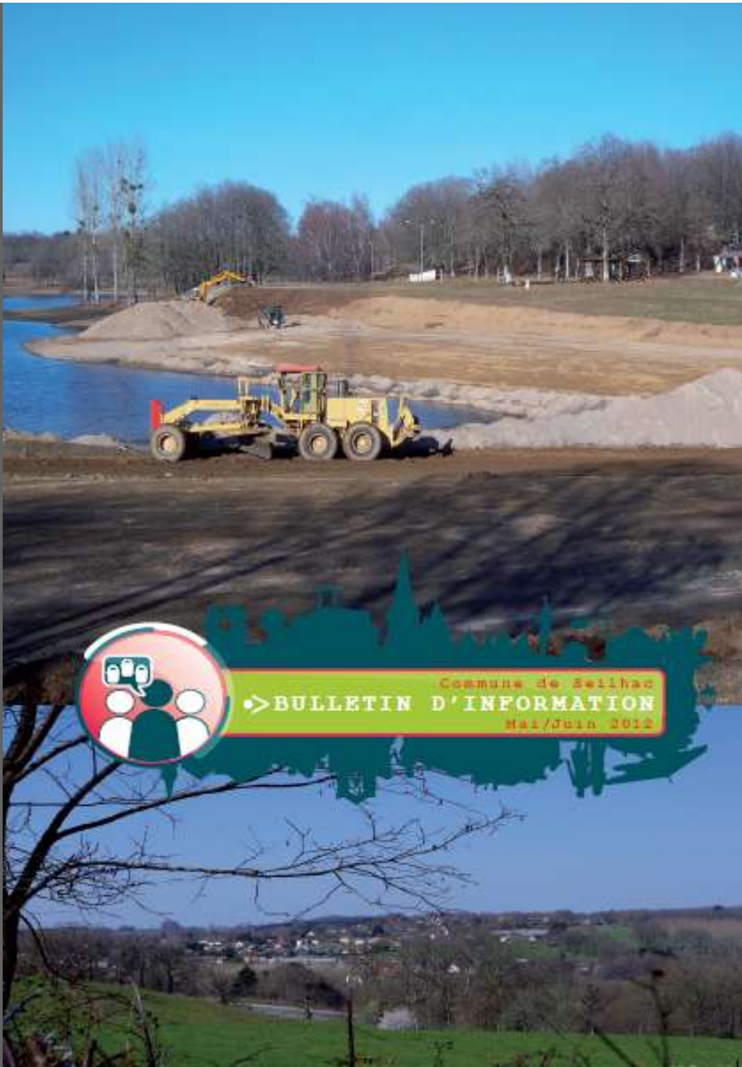
Bulletin Juin 2012