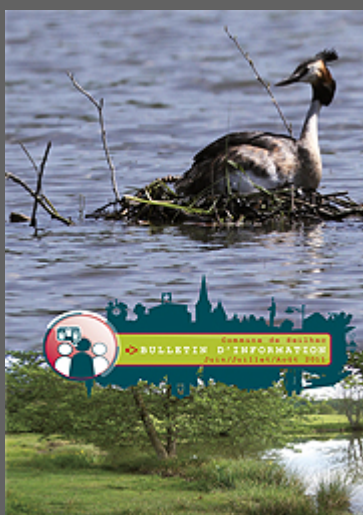
Bulletin Juin 2011