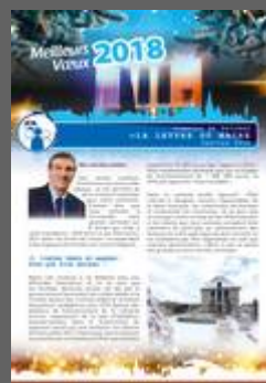
Lettre du Maire 2018