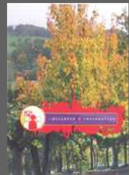
Bulletin Décembre 2013