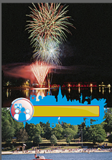
Bulletin Juillet 2009