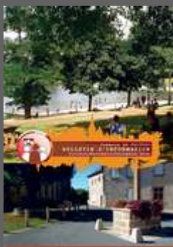
Bulletin Oct Nov Déc 2018