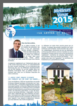
Bulletin janvier 2015