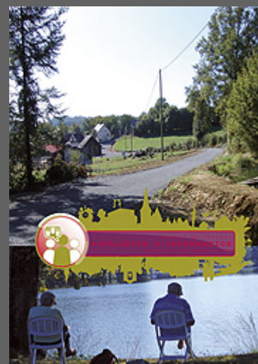
Bulletin Décembre 2009