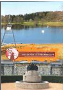
Bulletin Oct Nov Déc 2015