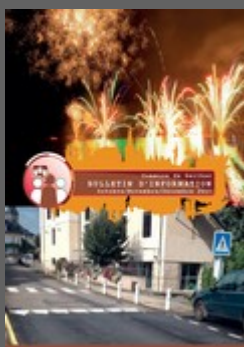
Bulletin Oct Nov Déc 2017