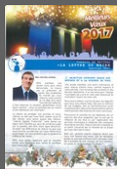
Lettre du Maire 2017