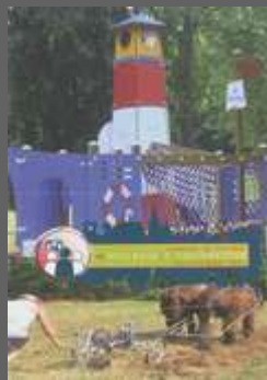
Bulletin Juillet août 2013