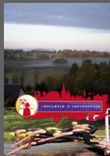
Bulletin Octobre 2011