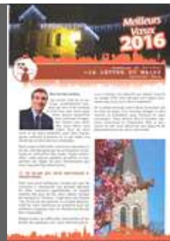
Lettre du Maire 2016