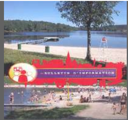
Bulletin Décembre 2012