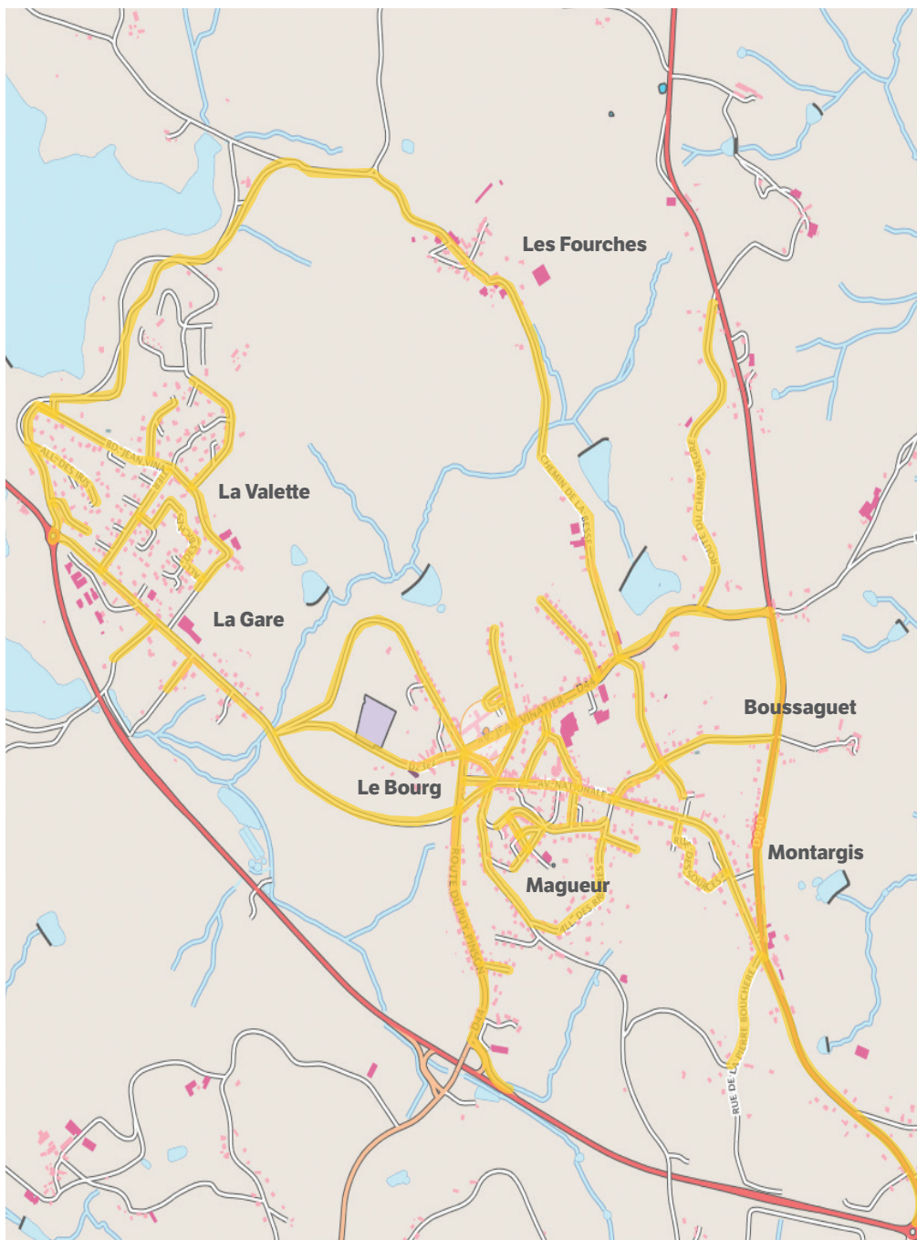
LE BOURG : CIRCUIT DE COLLECTE DES EMBALLAGES RECYCLABLES

Conception : Pépite Atelier - Ne pas jeter sur la voie publique. CITEO